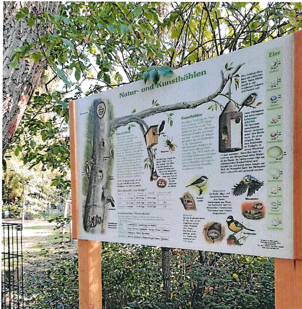
Infotafel auf dem Koppelland der Gemeinde Eichwalde