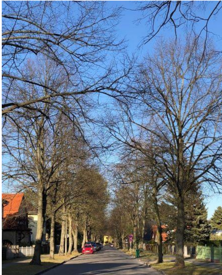
Straßenbaumallee in der Goethestraße der Gemeinde Eichwalde